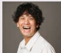
カメラマン紹介 森 祐輔 (もりゆうすけ) 株式会社スタジオhiyori 名古屋市東部倫理法人会所属

令和6年9月1日発行 通巻516号 発行所/一般社団法人 倫理研究所 愛知県倫理法人会 〒456-0034 名古屋市熱田区伝馬2丁目16-13 豊建ビル2F事務局・3F会議室 TEL:052-799-4286 FAX:052-799-4287 E-mail:douhou@rinri-aichi.jp 発行人/大塚祥吉 編集人/佐藤太賀始 製作/有限会社 東海写真植字・愛知県倫理法人会広報委員会 愛知県倫理法人会 ホームページアドレス https://rinri-aichi.jp