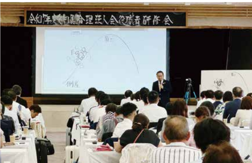
全体研修にて、リーダーシップについて学ぶ。