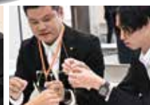
テーブルマナー講座