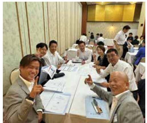
各地区に分かれて、明るく熱く前向きに議論しました。