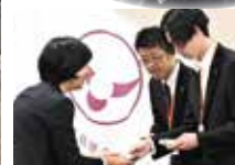
チームビルディング