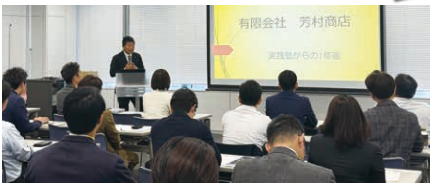
第1期修了生による「倫理経営計画」の報告