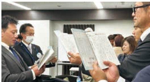
「職場の教養」を使つての実習