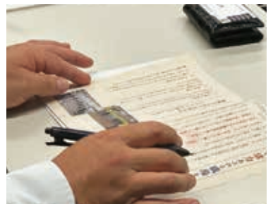
活力朝礼の新テキストを用いた研修