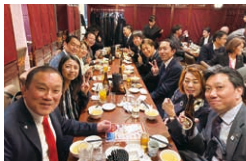
塾生と修了生が感想を語りあった懇親会