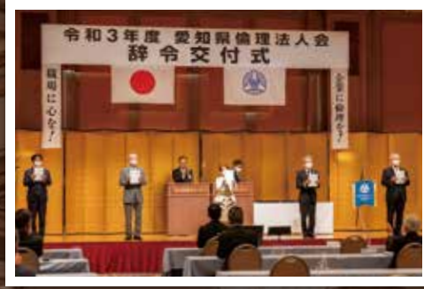
愛知県倫理法人会 相談役