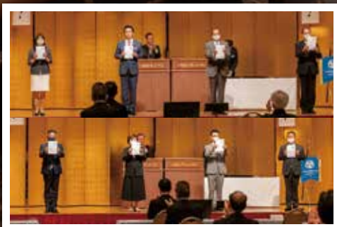
7委員会の委員長と後継者倫理塾 塾長