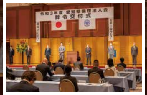
愛知県倫理法人会 地区長