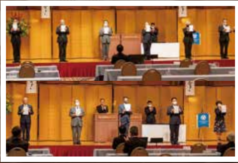
愛知県倫理法人会 副会長、正副幹事長、 正副事務長、監査