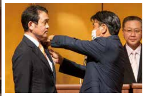
会長引き継ぎ並びに感謝状贈呈